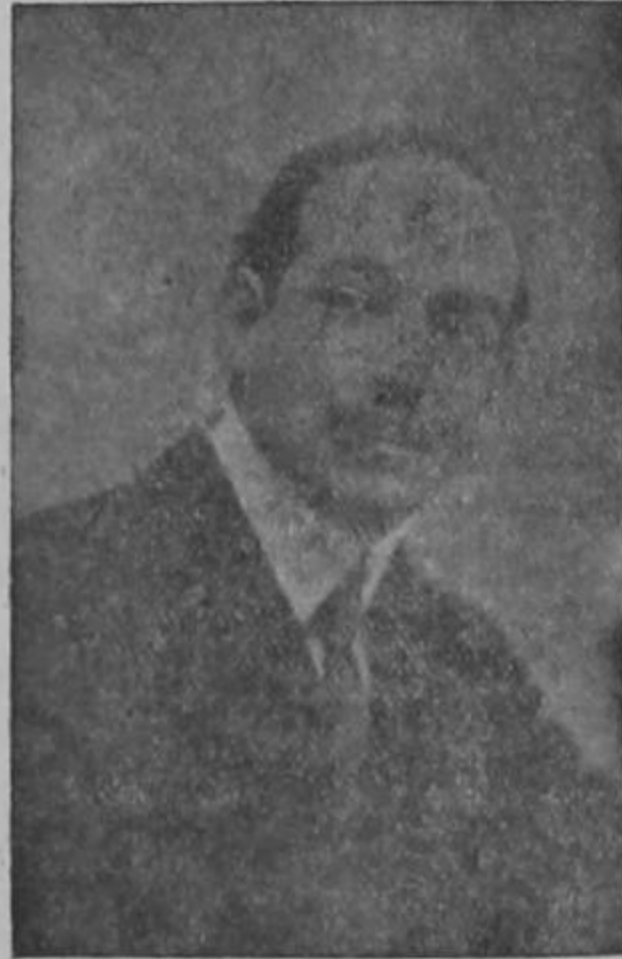
JOSE INGENIEROS, autor del artículo "Medicina de la voluntad"